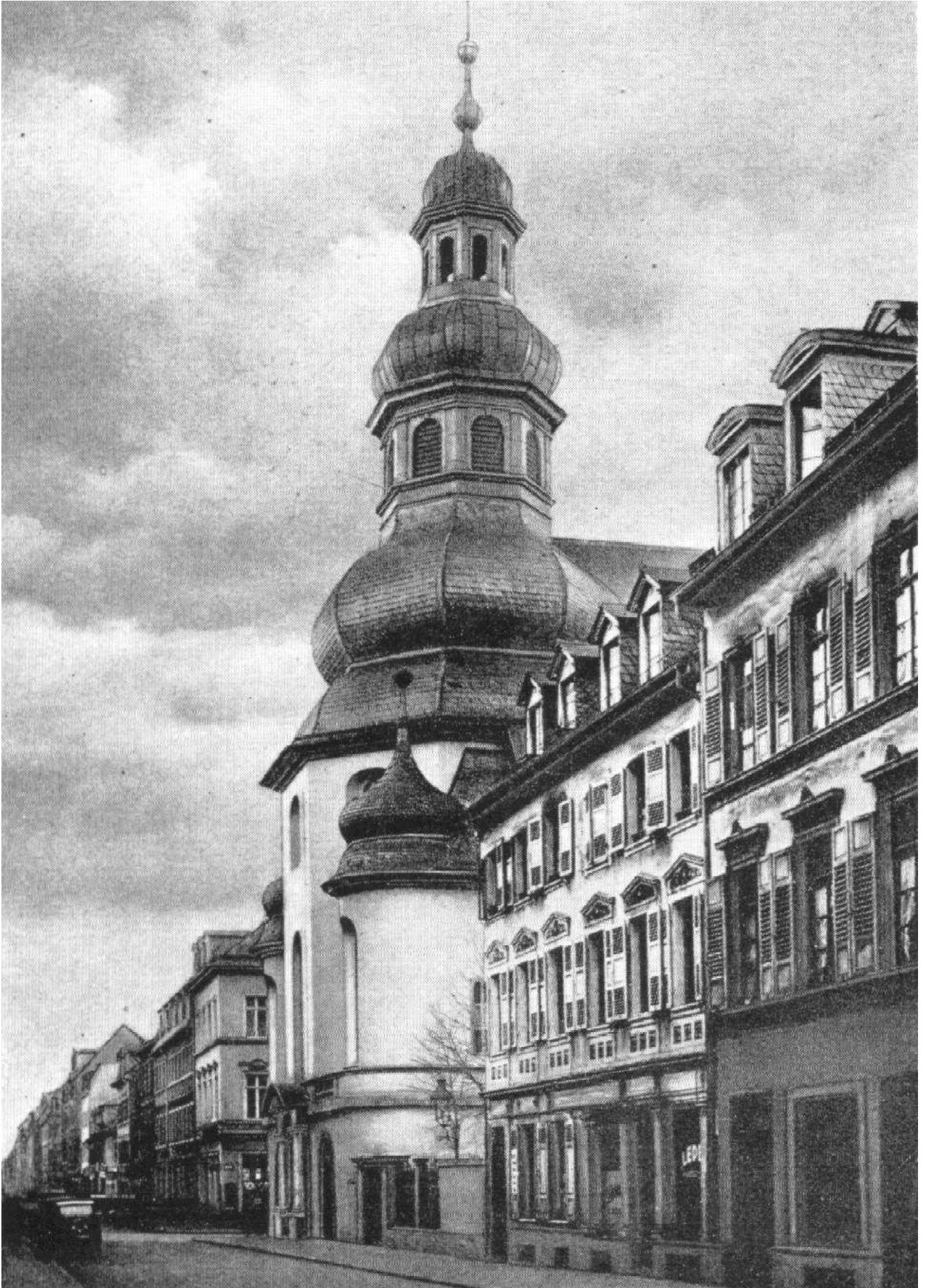
Alte Trinitatiskirche, von der Marktplatzseite her gesehen